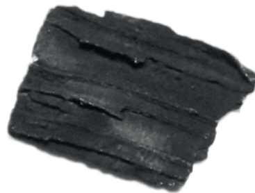
Возможная причина повреждения: осколки катализатора